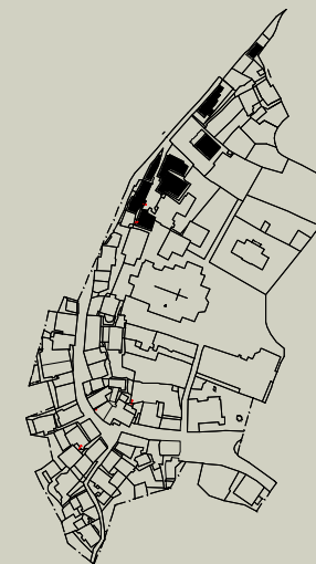
STRADA COMUNALE VARZO - LA COLLA COGGIA PIAZZA DELLA TORRE